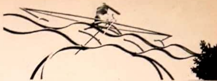
La intrarea bazei nautice de la lacul Belci, un artist ingenios a modelat din țevi acest schifist...

Au trecut doi ani și iată-ne, în această vară,